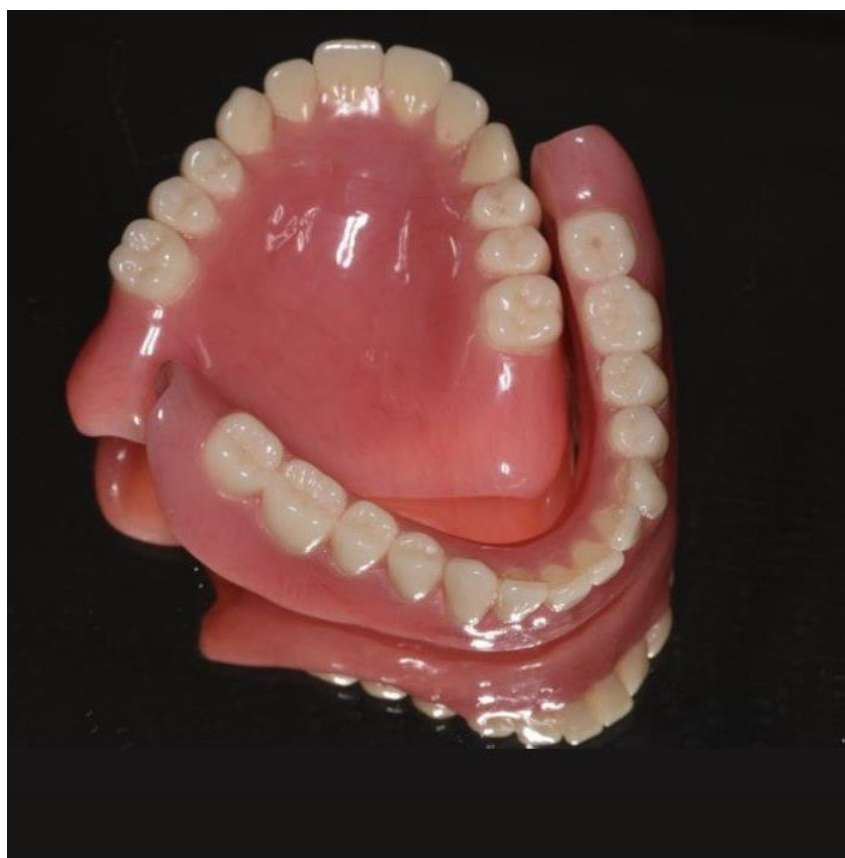
Полные съёмные протезы