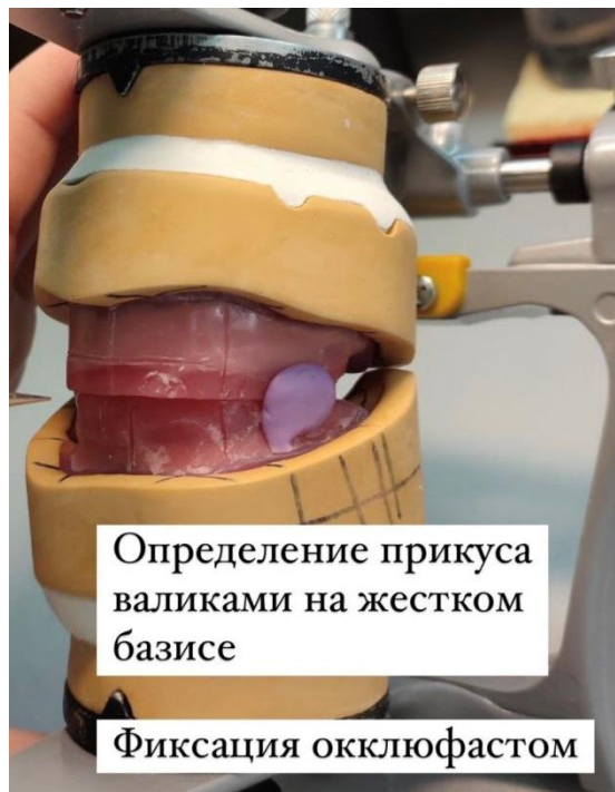
Определение прикуса валиками на жестком базисе